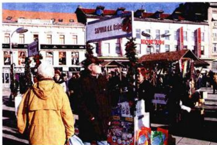
Naupitna legitimnost HGK-ove akcije "Kupujmo hrvatsko"

nužnost za budućnost 2006. godine poticalo se sloganom "Budimo kreativni - proizvodimo i kupujmo kvalitetno". Prošle godine slogan je glasio "Ovih blagdana odaberimo najbolje - kupujmo hrvatsko", kako bi se utjecalo na svijest građana da u vrijeme finansijske krize treba birati domaće proizvode kako bi se zaštitila radna mjesta, sigurnost mirovina i prosperitet budućih naraštaja. ■