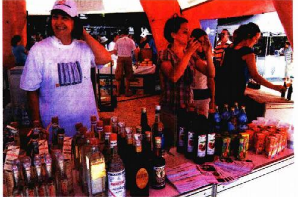
U akciji "Kupujmo hrvatsko" sudjelovalo je preko 150 tvrtki

NA OBALI KRALJA PETRA KREŠIMIRA IV. JUČER ODRŽANA AKCIJA "KUPUJMO HRVATSKO"