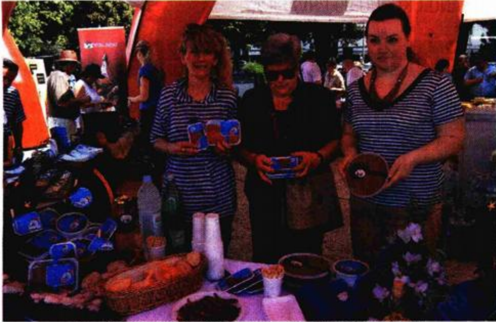
Smrznute srdele, fileti slanih inćuna u maslinovom i suncokretovom ulju tvrtke Arbacomerce pobudili su veliko zanimanje Zadrana