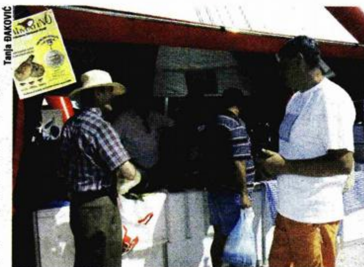
Na zadarskoj rivi predstavilo se 140 izlagača

- Hrvatska Gospodarska Komora pokazala je kontinuirana-