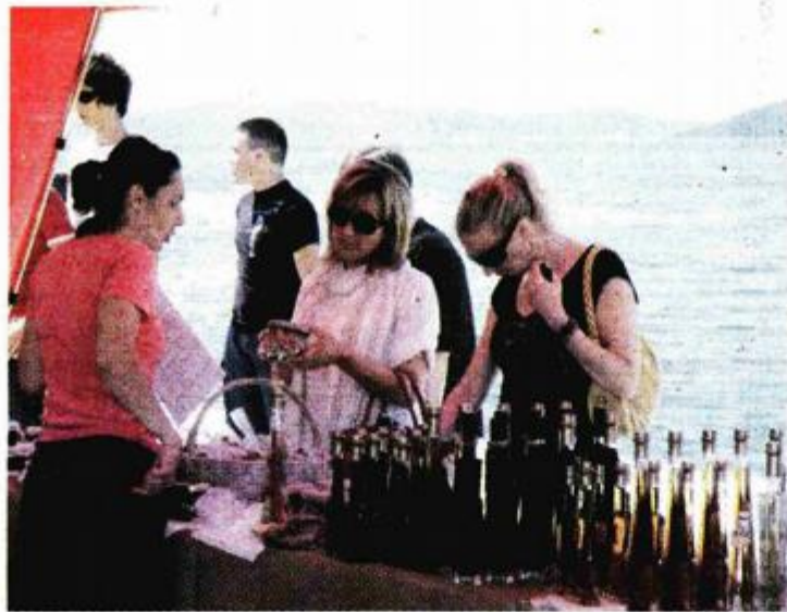
Zadranani su sa zanimanjem obilazili štandove