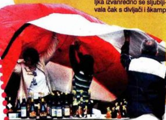
Poteškoća sa šatorom

Čak 500 proizvoda bilo je izloženo na štandovima u Puli, početnoj točki gospodarske karavane koja će obići 21 hrvatski grad. Velik broj proizvoda nosi titulu »Izvorno hrvatsko« ili »Hrvatska kvaliteta« što svjedoči o njihovoj izvrsnosti.