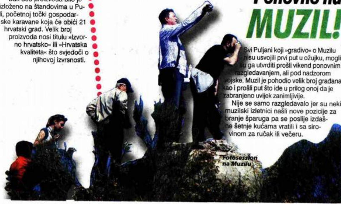
Fotoseslon na Muzilu

Nije se samo razgledavalo jer su neki muzilski izletnici našli nove pozicije za branje šparuga pa se posljuje izdašne šetnje kućama vratili i sa sirovinom za ručak ili večeru.